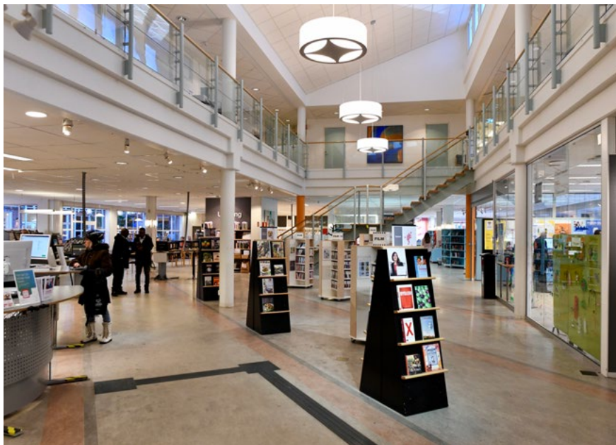
Bild 16. Kulturhuset Ängeln i Katrineholm 1989, bibliotek och samhällsservice. Arkitekt: Brunberg & Forshed Arkitektkontor.

Kulturhuset Ängeln (1989) i Katrineholm rymmer bibliotek, konsthall och café samt Servicekontor med Försäkringskassan, Skatteverket och Pensionsmyndigheten. I huset finns också kultur- och turismförvaltningen. Etableringen av Servicekontoret i kulturhuset innebär att dess verksamheter är lätt tillgängliga. Myndigheterna kan samverka eftersom de sitter tätt intill varandra. Språksvårigheterna övervinns lättare genom att personalen kan hjälpas åt. Ängeln erbjuder ett öppet rum att samlas i för många nyanlända och de får lättare kontakt med myndigheterna. Här planerar man att låta medborgarna kvittera ut egna nycklar till lokalerna. De ska vara öppna för dem som vill använda den publika ytan mitt i huset när som helst. Ängeln är också ett exempel på hur väl planerade och byggda lokaler med genomtänkta materialval över åren visar sig vara hållbara och åldras vackert.