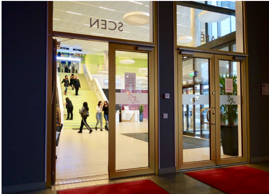
Bild 11. Messingen i Upplands Väsby 2011, entréhallen.