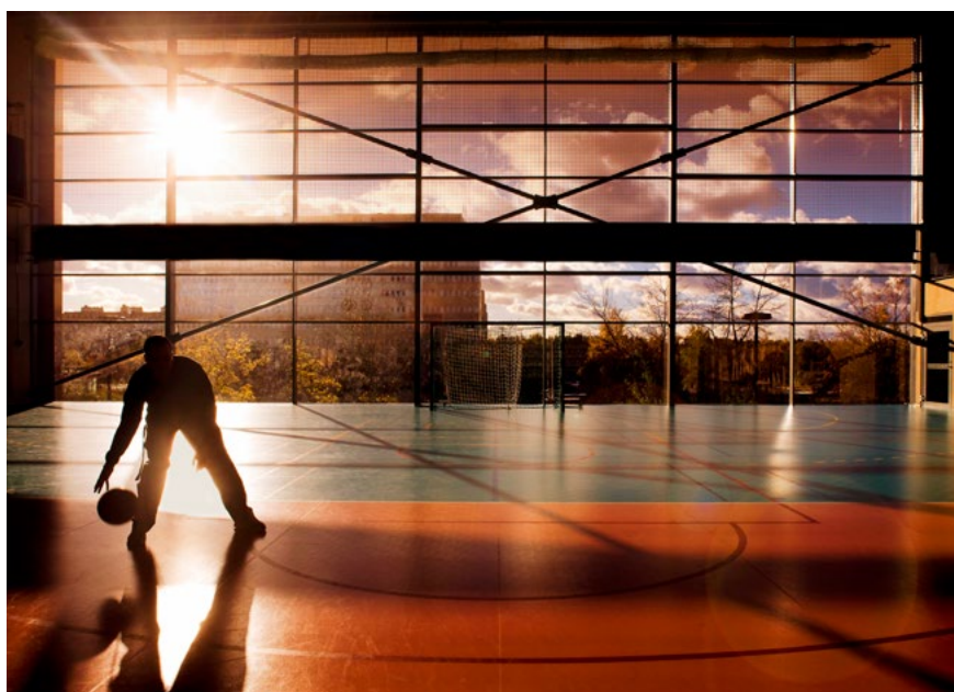
Bild 8. Arena satelliten i Sollentuna centrum 2009, idrottshall.