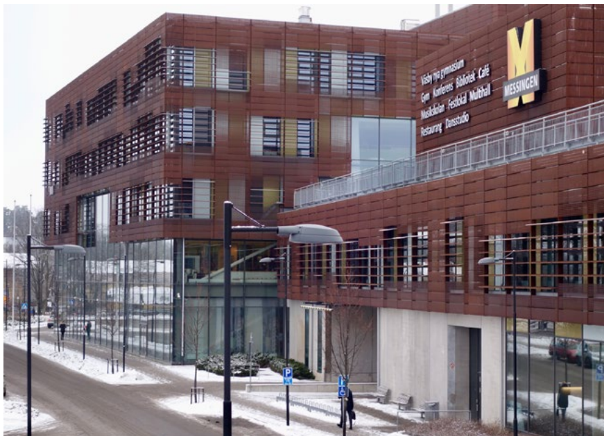
Bild 9. Messingen i Upplands Väsby 2011, exteriör. Arkitekt: White Arkitekter.