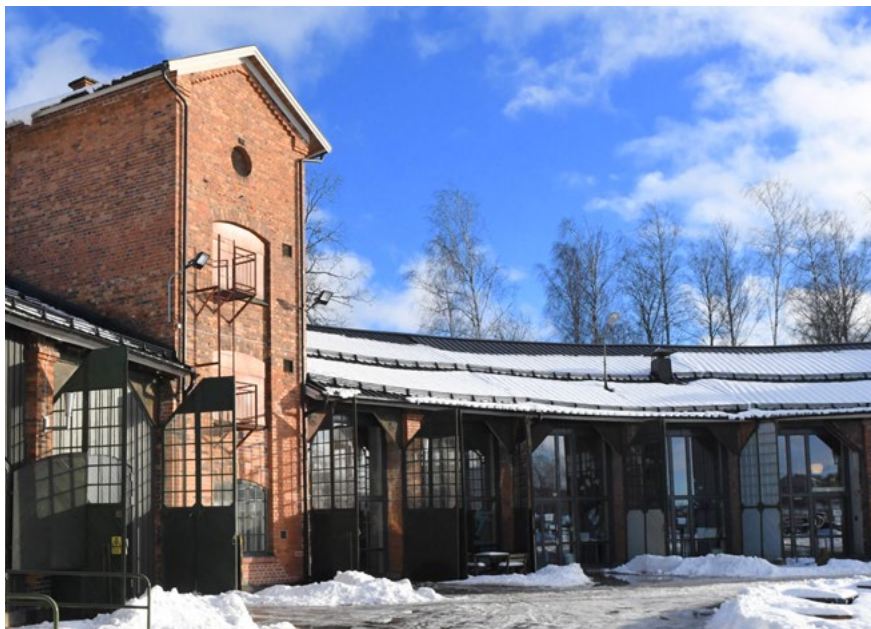
Bild 25. Lokstallet i Katrineholm, exteriör.