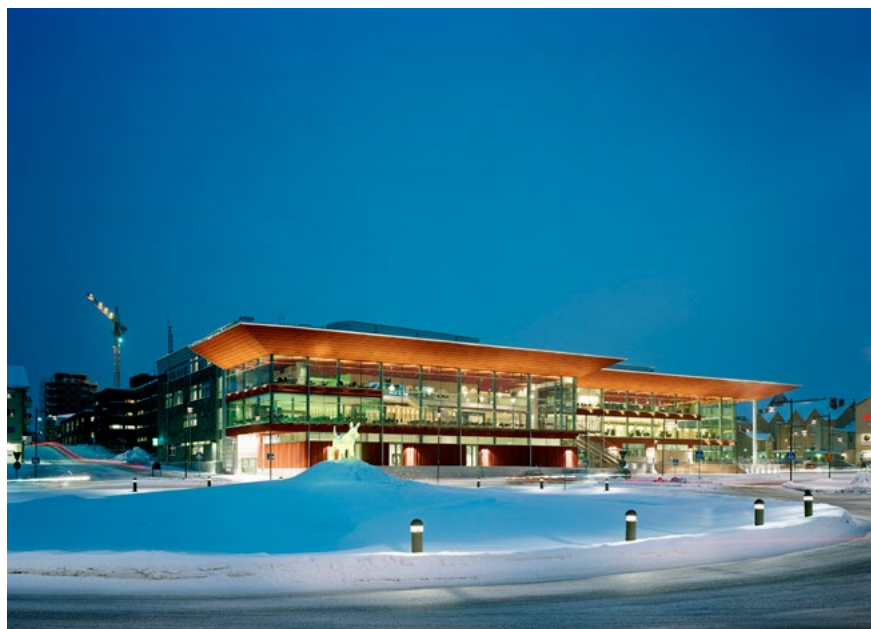
Bild 5. Kulturens Hus i Luleå 2005, exteriör. Arkitekt: Tirsén & Aili Arkitekter.