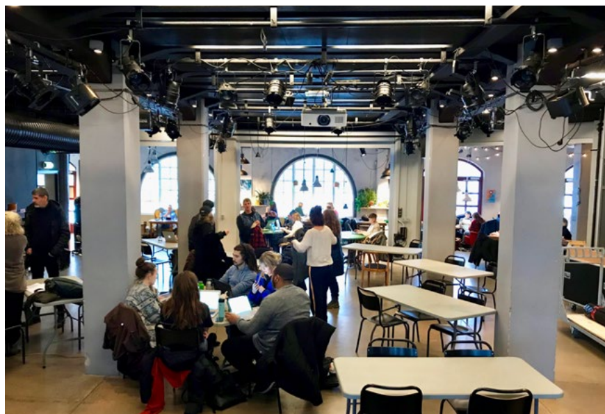
Bild 27. Frilagret i Göteborg, stora salen. En förebild vad gäller ungdomarnas egen organisering av verksamheten och återanvändning av hus och inredning.

Programarbetet är en avgörande del av byggprocessen. Det handlar om att översätta behov och önskemål till konkreta lokalprogram för lokaler med den dubbla uppgiften att ge de professionella kulturutövarna tillgång till scener och kontakt med sin publik, men också plattformar för eget skapande och personlig utveckling för kommuninvånarna.