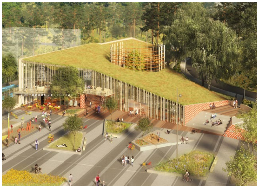
Bild 19. Kulturkorgen i Bergsjön, fågelperspektiv.