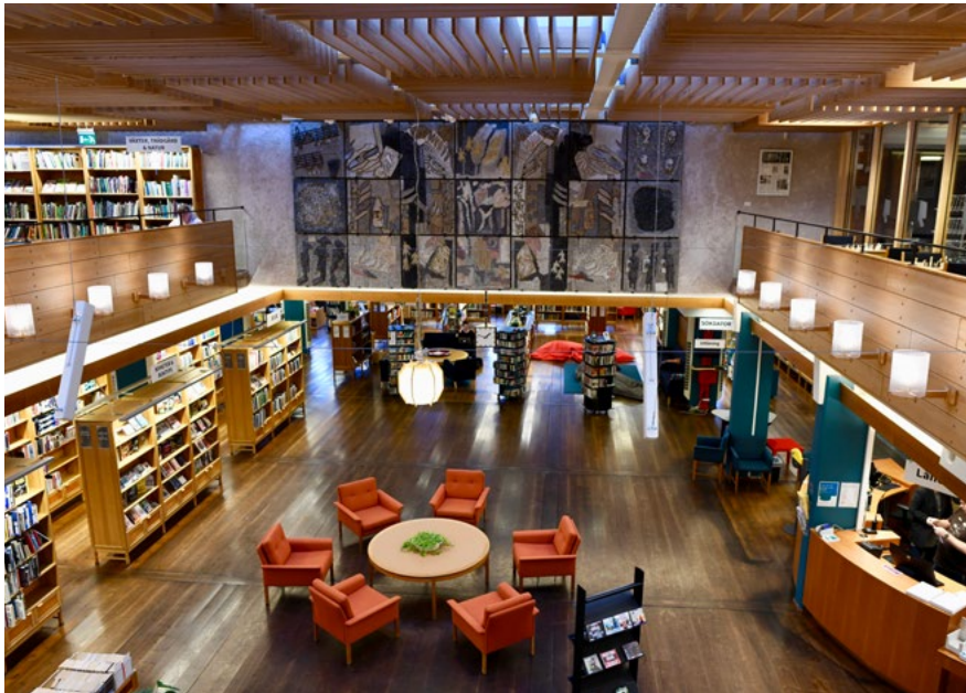
Bild 3. Kulturhuset i Skövde 1964, biblioteket.