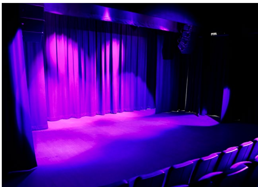
Bild 24. Lokstallet i Katrineholm, teater i en Black box.