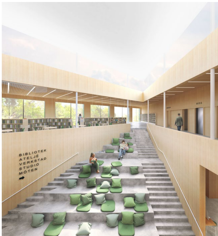
Bild 28. Gröna lyktan, atrium, tävlingsförslag. Arkitekt och bild: Tham & Videgård arkitekter

stora rummet med glasytor mot torget annonseras kulturhuset och dess verksamheter blir synliga utifrån. Man sänker tröskeln ”för den mer ovane kulturhusbesökaren” som från ”entrén leds in i husets hjärta, ett ljusfyllt atrium som samlar reception, medborgarkontor och foajé till de två scenerna”. Öppenheten kräver en särskild omsorg i utformningen för att det stora rummet ska inbjudas till och fungera för möten av vitt skilda slag.