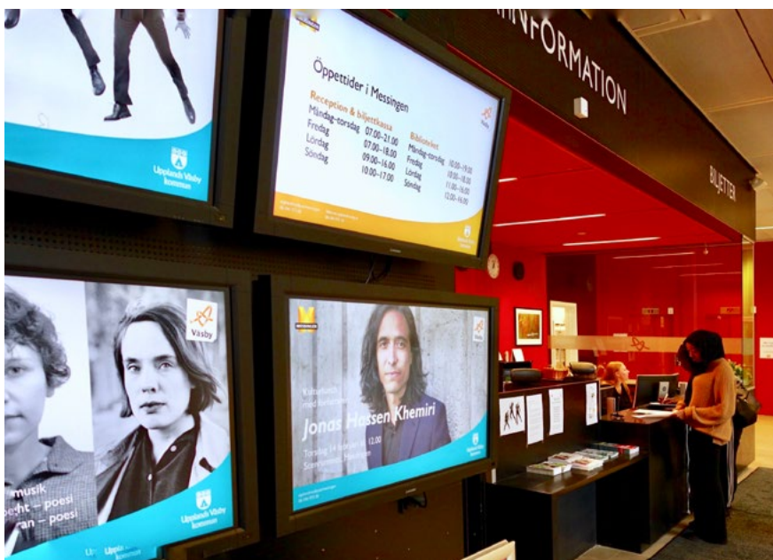
Bild 10. Messingen i Upplands Väsby 2011, receptionen.