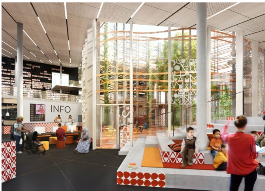
Bild 18. Kulturkorgen i Bergsjön, Göteborg, interiör.