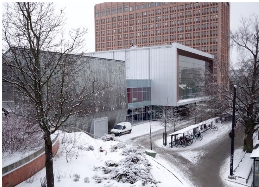
Bild 7. Arena Satelliten i Sollentuna centrum 2009, exteriör. Arkitekt: White Arkitekter.