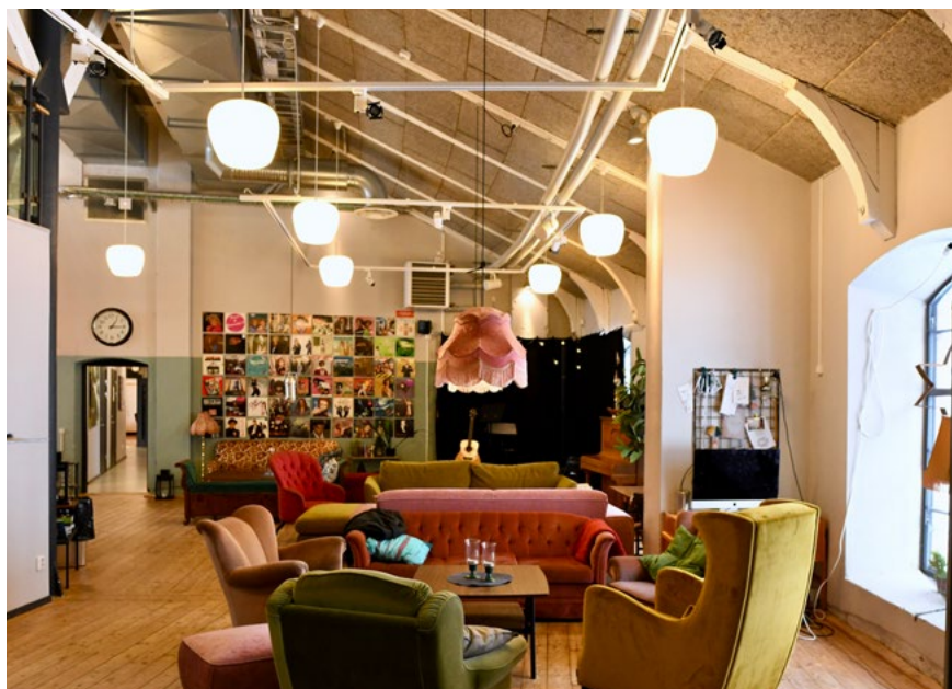
Bild 23. Lokstallet i Katrineholm, mötesplatser.