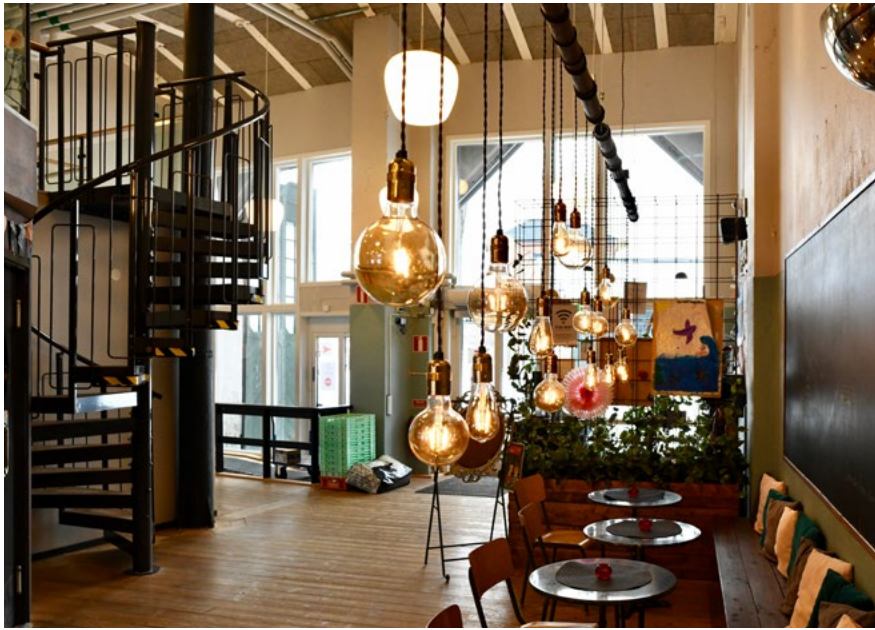
Bild 21. Lokstallet i Katrineholm, entré och café.