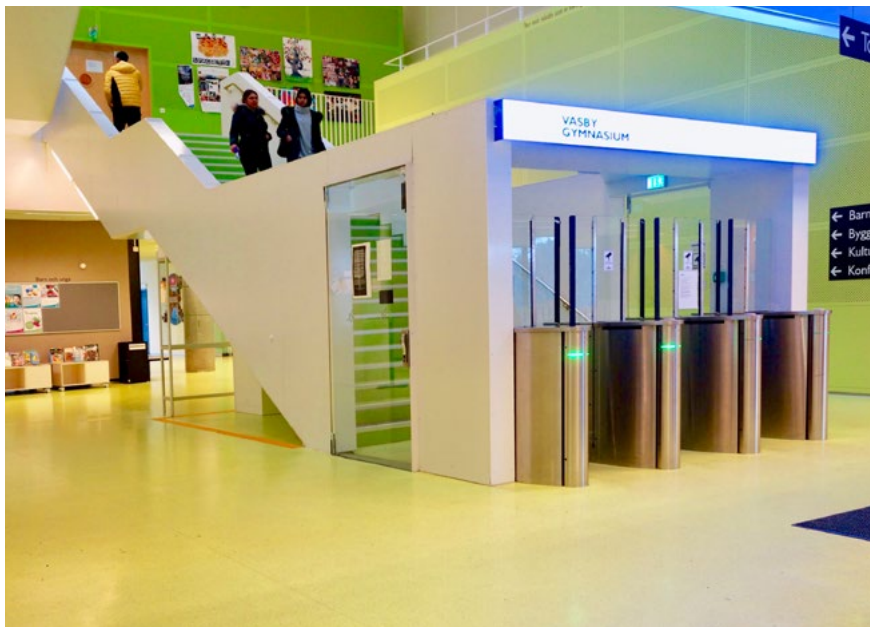
Bild 12. Messingen i Upplands Väsby, 2011, säker entré till skollokalerna.