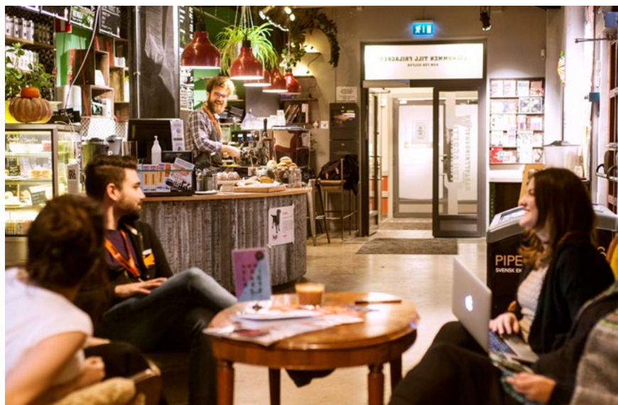
Bild 1. Frilagret i Göteborg. "Frilagret är ditt kulturhus mitt i stan, här är det du som bestämmer. Våra lokaler är flexibla och det mesta går att ordna - vi jobbar för dig och ditt projekt."