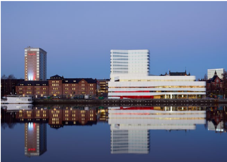
Bild 13. Väven i Umeå 2014, exteriör. Arkitekter: Snøhetta och White Arkitekter.

Mycket omtalat är kulturhuset Väven (2014) i Umeå som rymmer bibliotek, teater, bio, museum och samlingslokaler. Men också kommersiell verksamhet som hotell, kontor, restaurang, café och saluhall. Den kommersiella verksamheten är ett påfallande inslag och har väckt en debatt om tillgång till överkomliga lokaler för eget skapande. Väven är ett exempel på ett kulturhus där generalitet varit en drivande idé vid utformningen. Det är en gallerialik byggnad som kan användas på olika sätt, men som därför kan vara svår att orientera sig i. Den fyller en viktig funktion i Umeås nya stadsbild i kulturstråket utmed Umeälven.