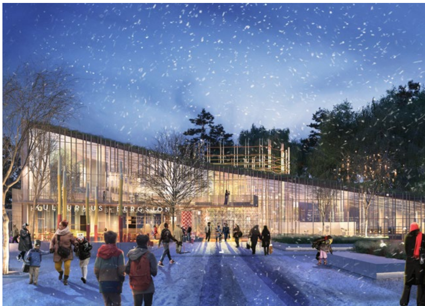
Bild 17. Kulturkorgen i Bergsjön, Göteborg, vinnande tävlingsförslag, exteriör. Arkitekt och bild: Sweco Architects