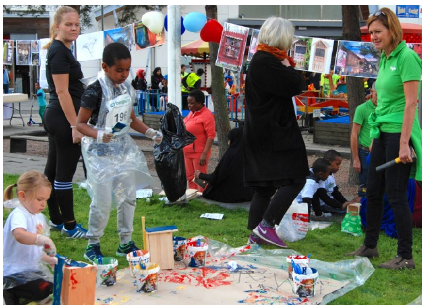
Bild 20. Kulturkorgen i Bergsjön, samråd inför planeringen av det nya kulturhuset.